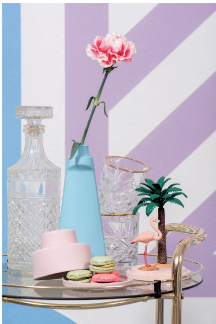
Urban Optimism Art Deco 15.jpg