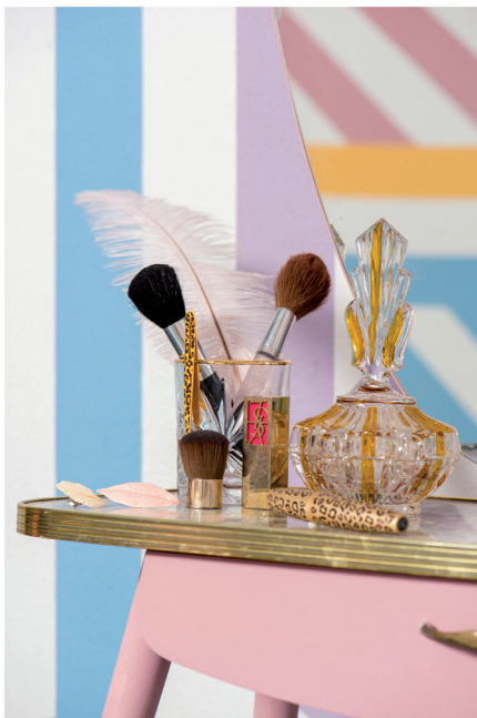
Urban Optimism Art Deco 13.jpg