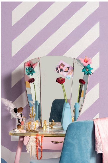
Urban Optimism Art Deco 09.jpg