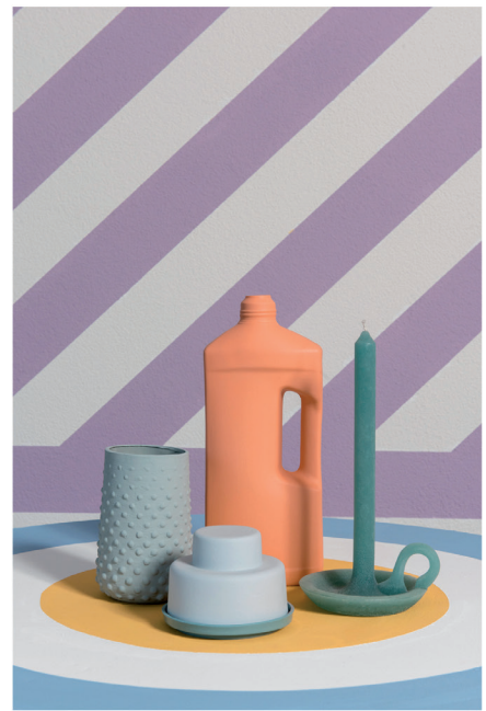
Urban Optimism Art Deco 08.jpg