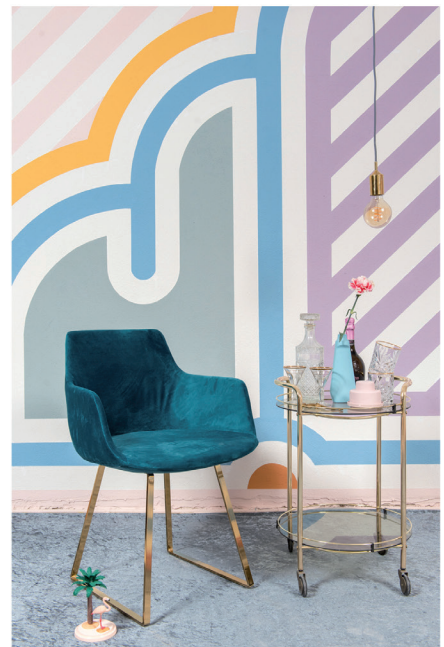
Urban Optimism Art Deco 14.jpg