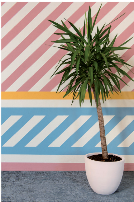
Urban Optimism Art Deco 07.jpg