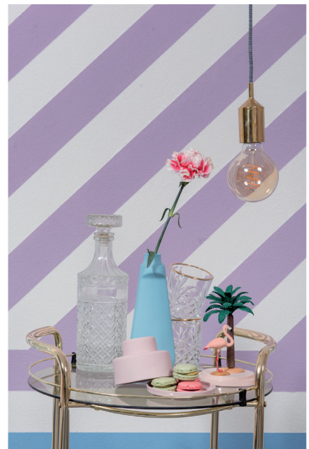
Urban Optimism Art Deco 16.jpg