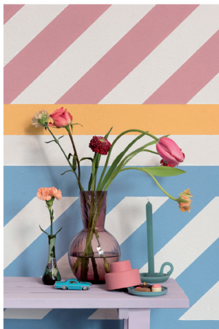
Urban Optimism Art Deco 03.jpg