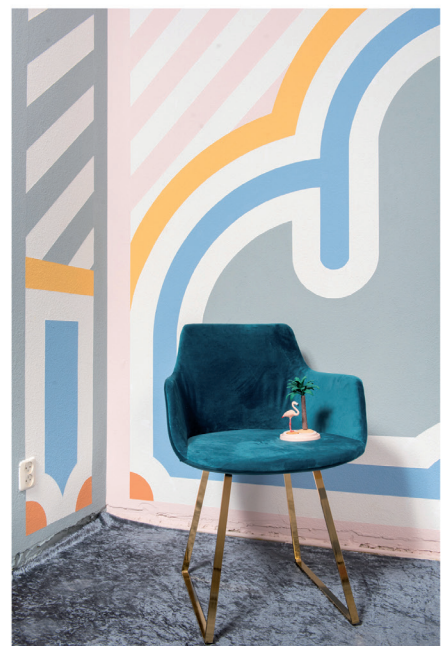
Urban Optimism Art Deco 18.jpg

Terms and Conditions apply, copyright @ Suzanne Paap, BloomInspiration.