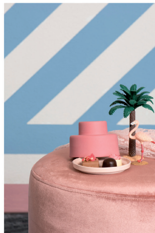
Urban Optimism Art Deco 04.jpg