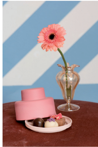
Urban Optimism Art Deco 02.jpg