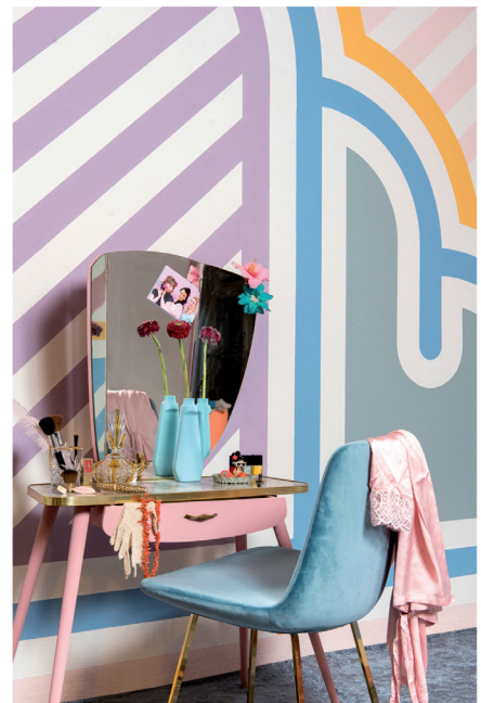
Urban Optimism Art Deco 10.jpg