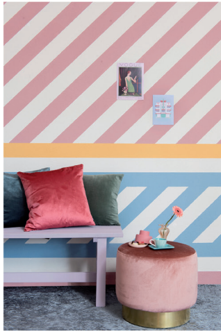
Urban Optimism Art Deco 01.jpg