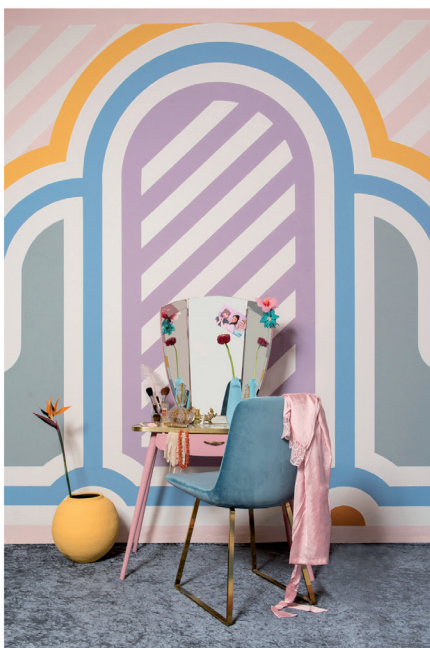
Urban Optimism Art Deco 11.jpg