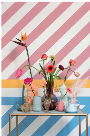
Urban Optimism Art Deco 05.jpg