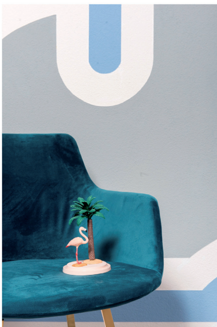
Urban Optimism Art Deco 17.jpg