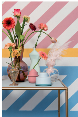
Urban Optimism Art Deco 06.jpg