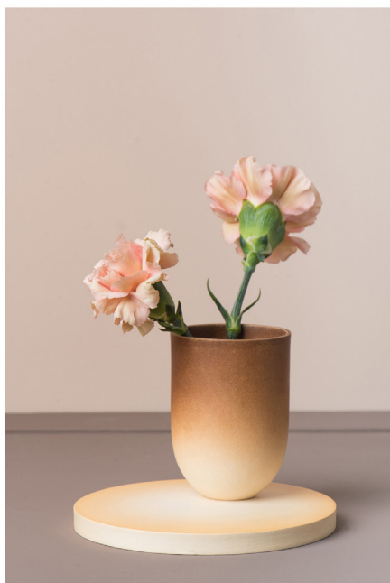
BLOO_New African 17.jpg