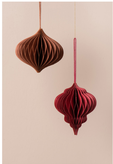
BLOO_New African 12.jpg

Terms and Conditions apply, copyright @ Suzanne Paap, BloomInspiration.