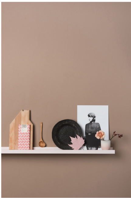
BLOO_New African 19.jpg