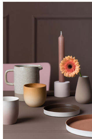
BLOO_New African 04.jpg