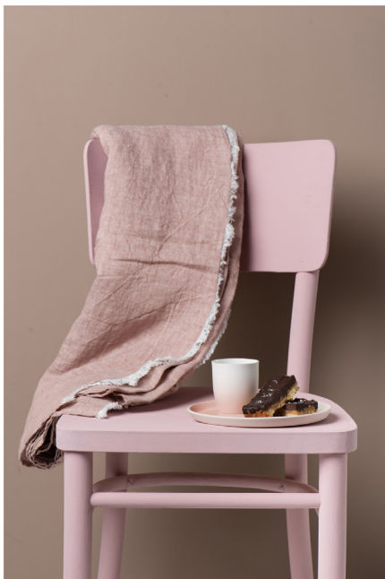
BLOO_New African 27.jpg