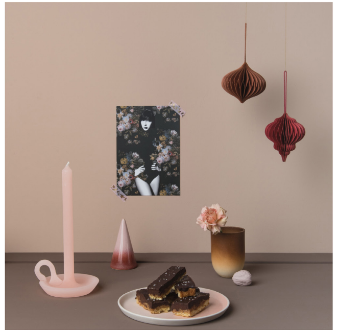
BLOO_New African 10.jpg