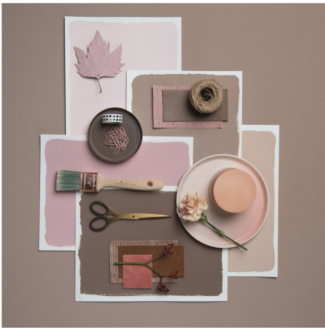
BLOO_New African 37.jpg