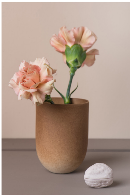
BLOO_New African 13.jpg