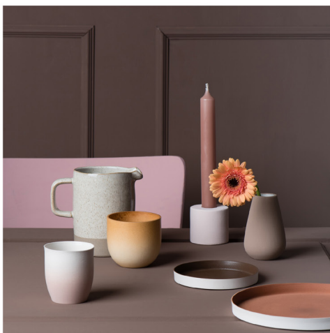
BLOO_New African 05.jpg