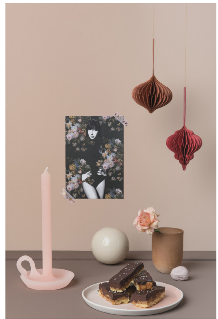
BLOO_New African 08.jpg