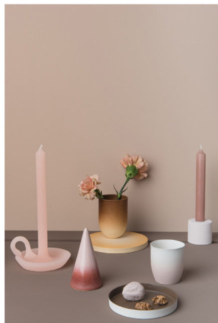
BLOO_New African 18.jpg

Terms and Conditions apply, copyright @ Suzanne Paap, BloomInspiration.