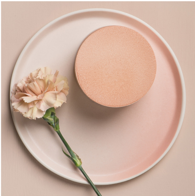
BLOO_New African 39.jpg