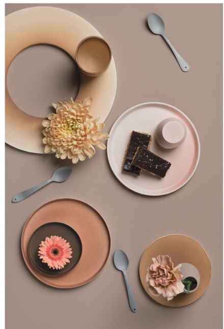
BLOO_New African 42.jpg

Terms and Conditions apply, copyright @ Suzanne Paap, BloomInspiration.