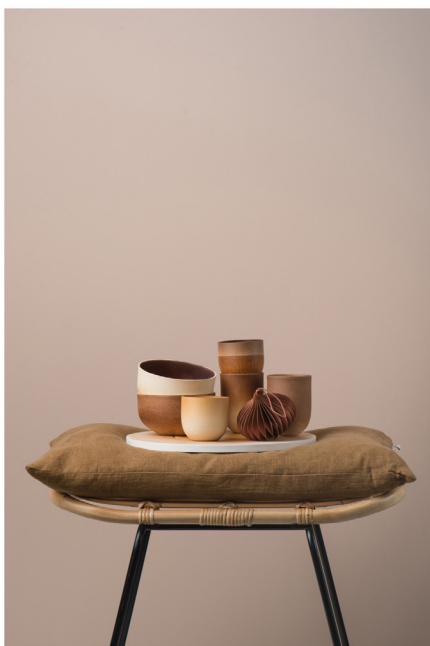
BLOO_New African 35.jpg