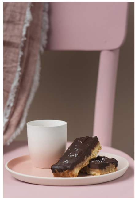
BLOO_New African 28.jpg