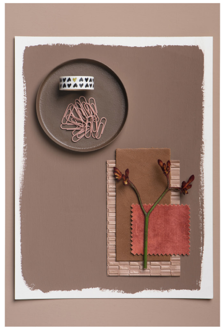
BLOO_New African 38.jpg