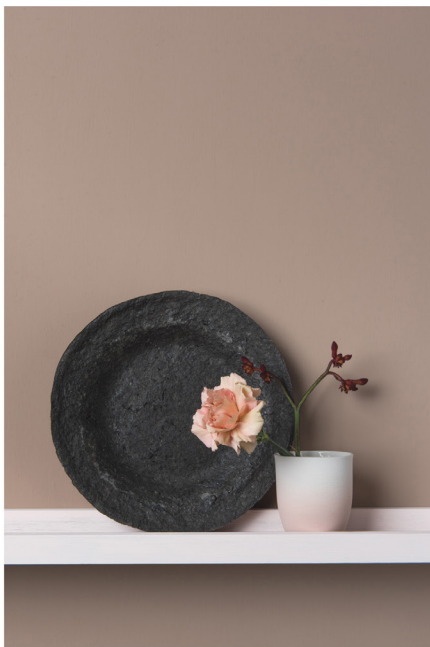
BLOO_New African 25.jpg