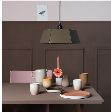
BLOO_New African 02.jpg