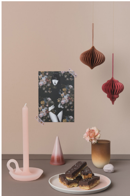
BLOO_New African 09.jpg