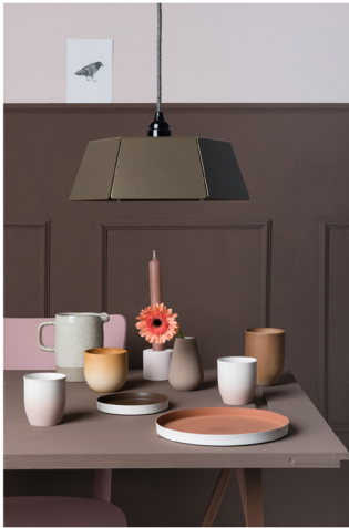
BLOO_New African 01.jpg