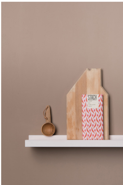
BLOO_New African 21.jpg