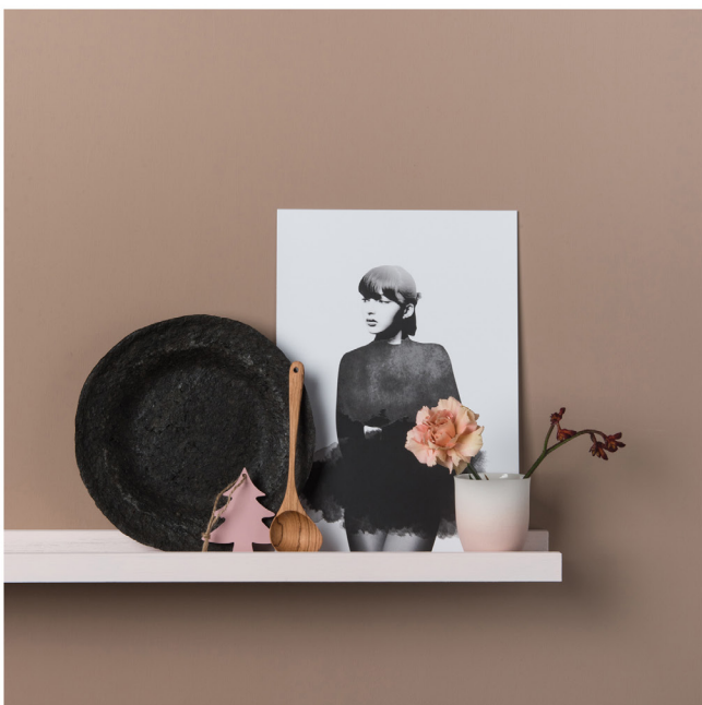
BLOO_New African 23.jpg