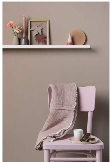
BLOO_New African 26.jpg