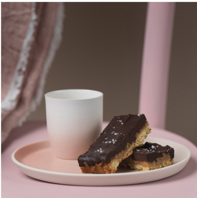
BLOO_New African 29.jpg