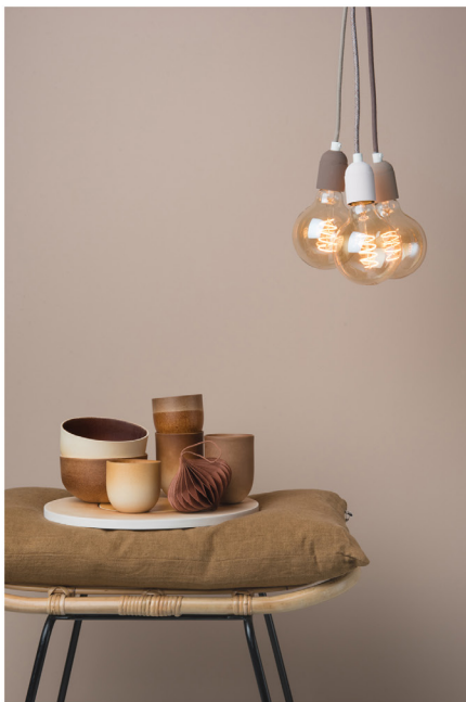
BLOO_New African 31.jpg