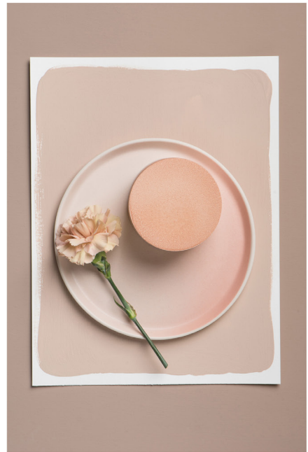
BLOO_New African 40.jpg