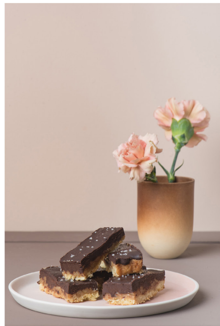
BLOO_New African 16.jpg