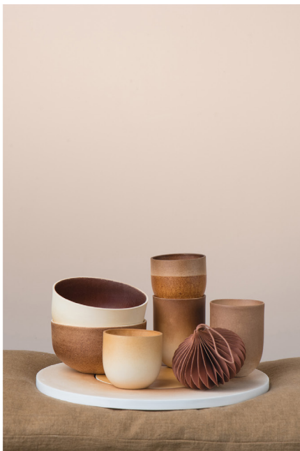
BLOO_New African 33.jpg