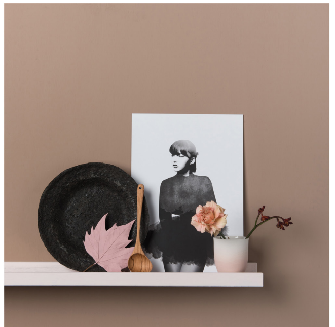
BLOO_New African 22.jpg