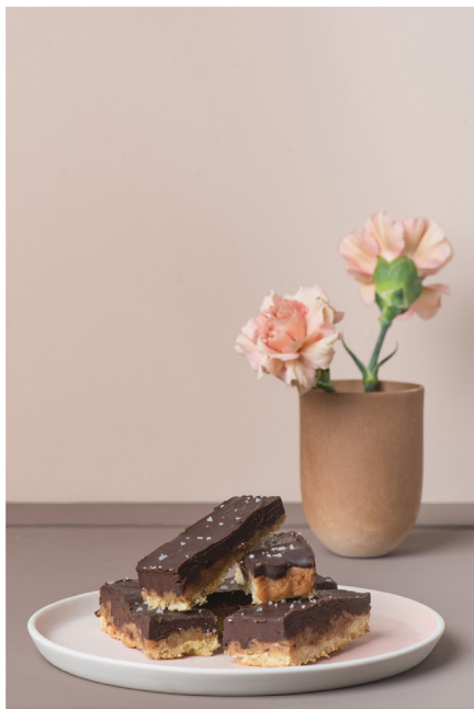
BLOO_New African 15.jpg