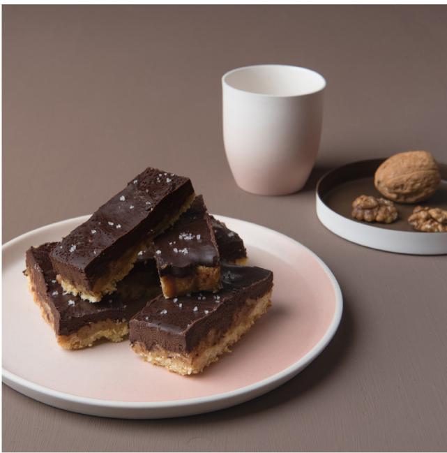
BLOO_New African 07.jpg