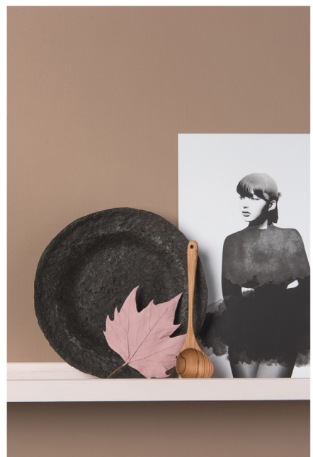
BLOO_New African 24.jpg

Terms and Conditions apply, copyright @ Suzanne Paap, BloomInspiration.