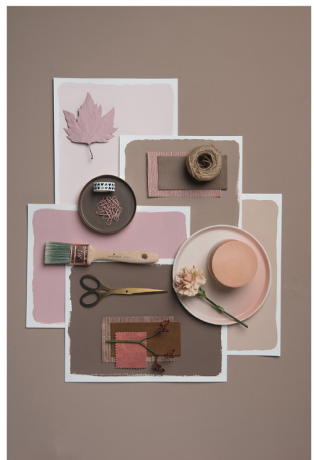
BLOO_New African 36.jpg

Terms and Conditions apply, copyright @ Suzanne Paap, BloomInspiration.