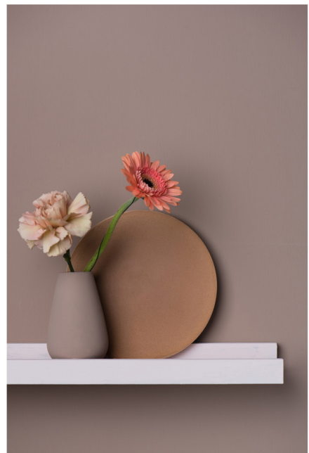
BLOO_New African 30.jpg

Terms and Conditions apply, copyright @ Suzanne Paap, BloomInspiration.