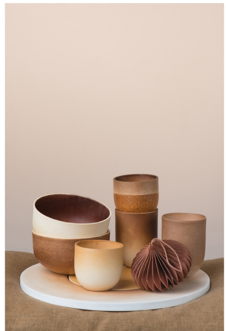
BLOO_New African 34.jpg