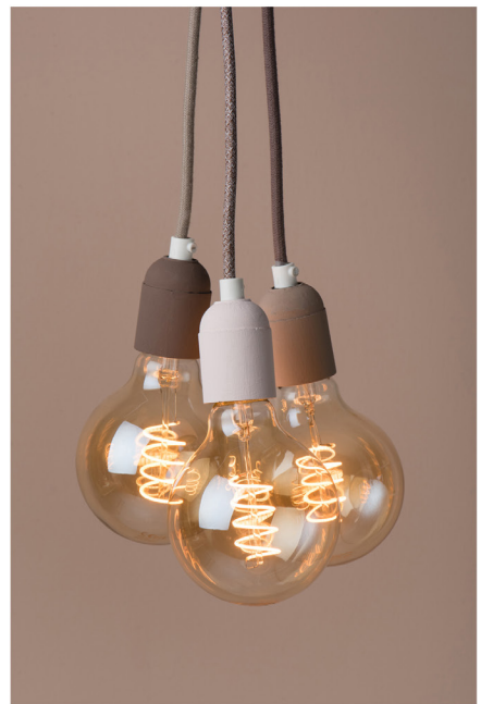
BLOO_New African 32.jpg