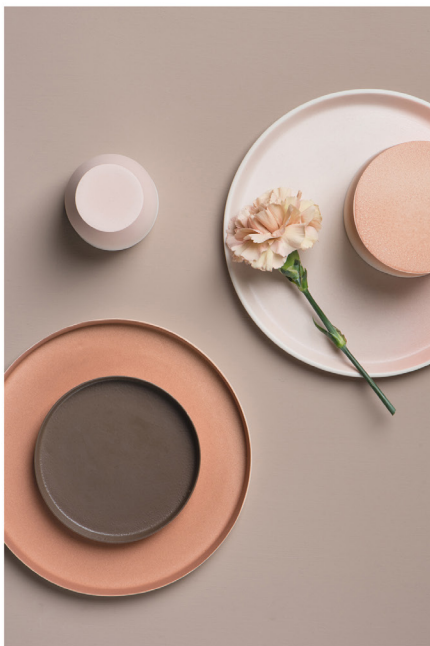
BLOO_New African 41.jpg