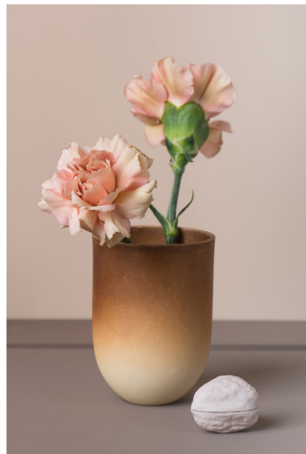
BLOO_New African 14.jpg