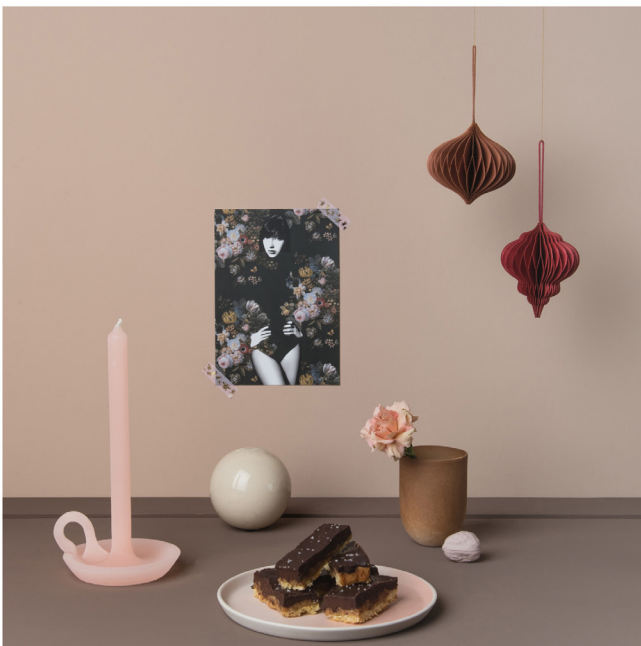
BLOO_New African 11.jpg