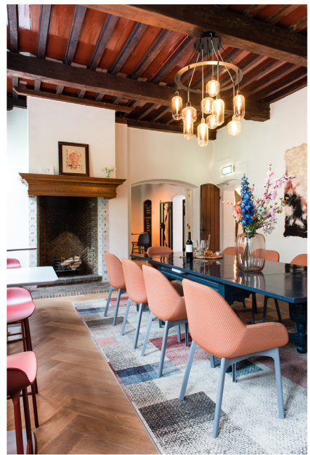
Wijnbar Zuster Margaux 20.jpg