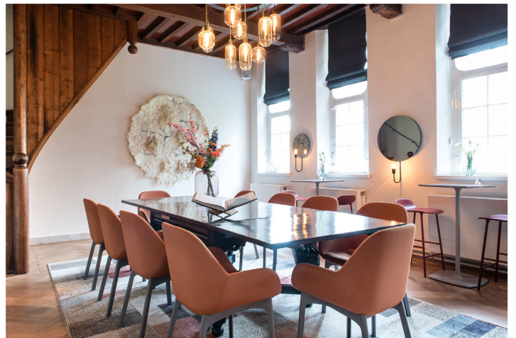
Wijnbar Zuster Margaux 16.jpg