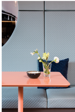
Wijnbar Zuster Margaux 06.jpg

Terms and Conditions apply, copyright @ Suzanne Paap, BloomInspiration.