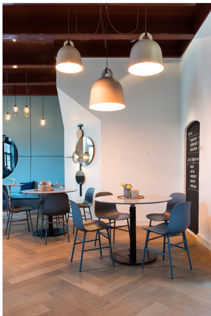
Wijnbar Zuster Margaux 13.jpg