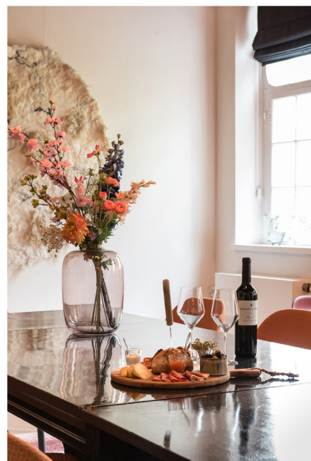
Wijnbar Zuster Margaux 18.jpg

Terms and Conditions apply, copyright @ Suzanne Paap, BloomInspiration.