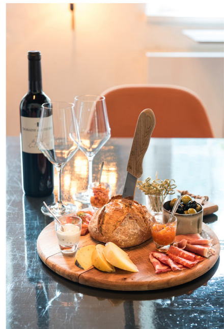
Wijnbar Zuster Margaux 26.jpg