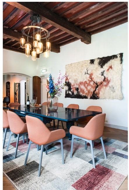
Wijnbar Zuster Margaux 22.jpg