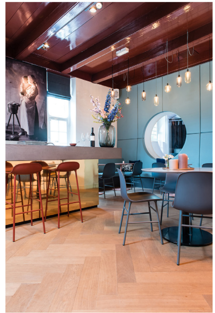
Wijnbar Zuster Margaux 02.jpg