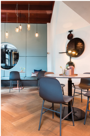
Wijnbar Zuster Margaux 03.jpg