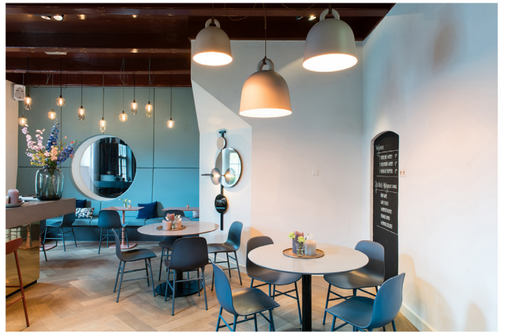
Wijnbar Zuster Margaux 14.jpg