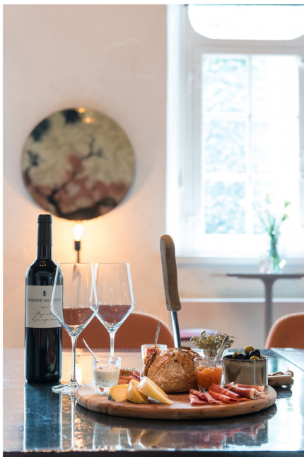
Wijnbar Zuster Margaux 25.jpg