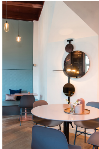
Wijnbar Zuster Margaux 04.jpg