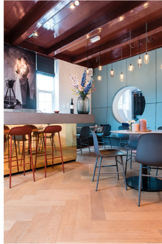
Wijnbar Zuster Margaux 02.jpg