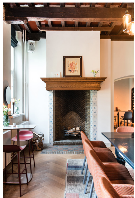
Wijnbar Zuster Margaux 24.jpg

Terms and Conditions apply, copyright @ Suzanne Paap, BloomInspiration.