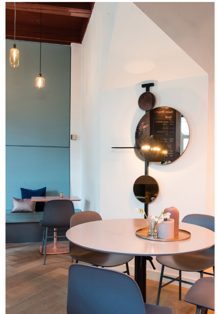
Wijnbar Zuster Margaux 04.jpg