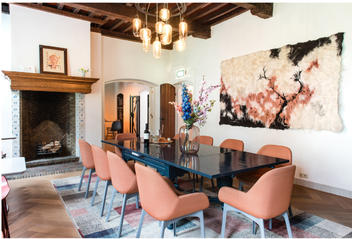
Wijnbar Zuster Margaux 21.jpg