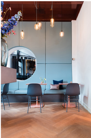
Wijnbar Zuster Margaux 05.jpg