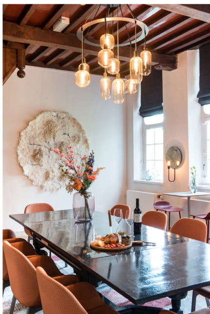
Wijnbar Zuster Margaux 17.jpg