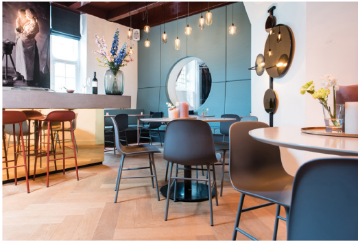
Wijnbar Zuster Margaux 01.jpg