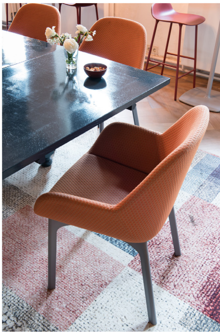
Wijnbar Zuster Margaux 19.jpg