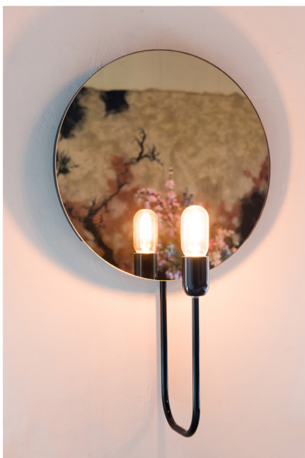
Wijnbar Zuster Margaux 23.jpg