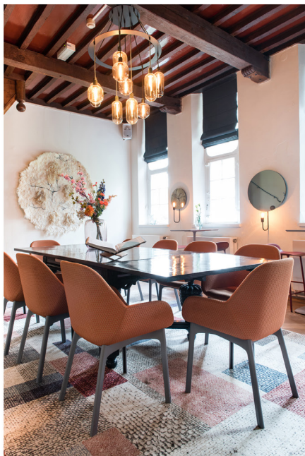
Wijnbar Zuster Margaux 15.jpg